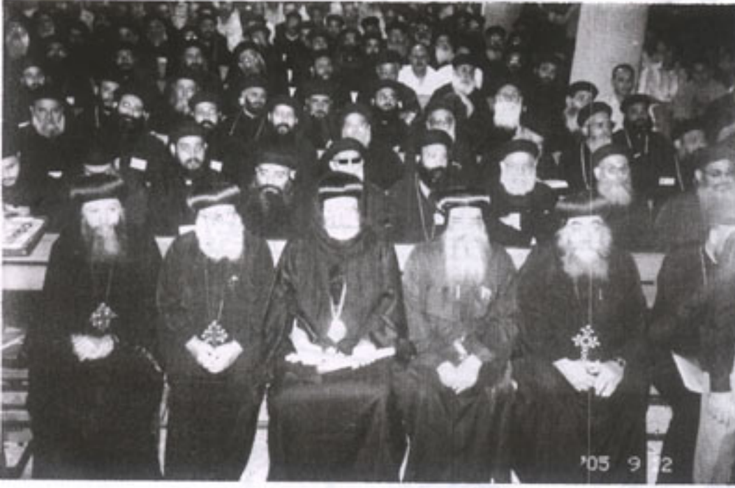
بعض الآباء المظارنة والأساقفة الكهنة في حضور المؤتمر - وفي الأسفل بعض الحاضرين