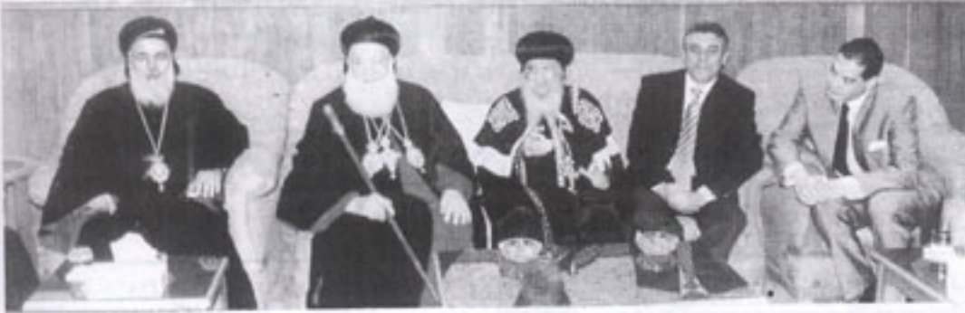
مع قداسة البطريرك مار زكا والمطران جورج صليبيا والسيد حازم خيرت سفير مصر في سوريا

ثم توجه موكب قداسته من مطار بيروت إلى دمشق، وعند الحدود السورية اللبناية كان في استقبال قداسته: قداسة البطريرك مار اغناطيوس زكا الأول بطريرك أنطاكية وسائر المشرق للسريان الأرثوذكس. ووفد من الآباء المطارنة السريان: أصحاب النيافة المطران جورج صليبيا، والمطران بطرس سلوانس، والمطران إيليا باهى، والمطران بولس صفر. كما كان في استقبال قداسته السفير المصرى السيد حازم خيرت سفير مصر بسوريا،