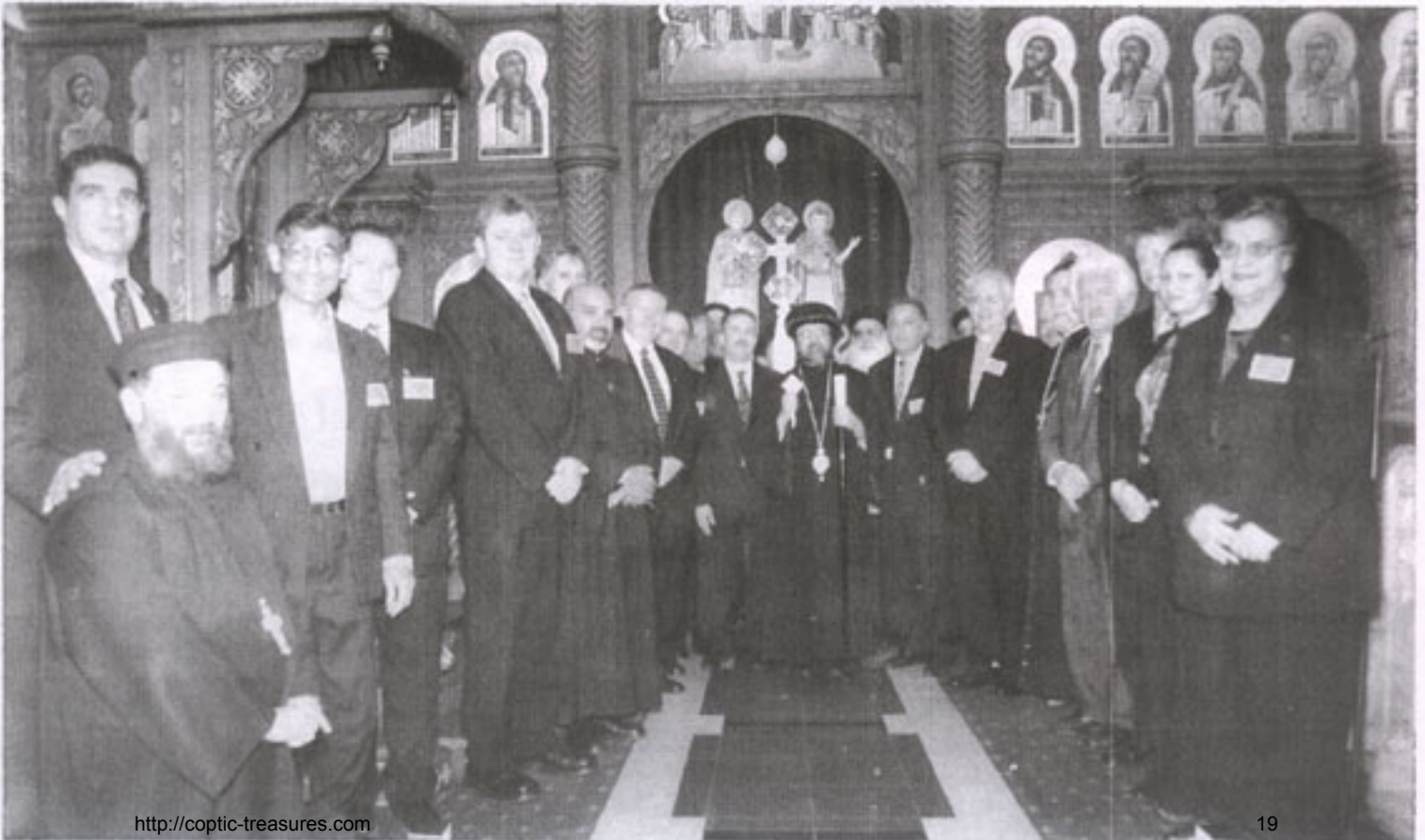
نيافة الأنبا دانييل - مع كبار الزوار - فى كاتدرائية العذراء ومارينا فى بكسلى